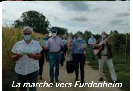
La marche vers Furdenheim

Une Opération Jouets pour des enfants de familles défavorisées accompagnées par le Centre social protestant de Strasbourg a permis de préparer de très nombreux cadeaux grâce aux jouets donnés par des familles de la commune et à des dons.