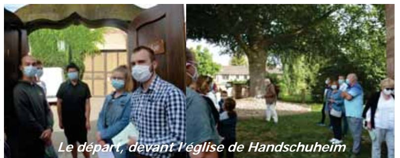
Le départ, devant l'église de Handschuheim

Le dimanche 6 septembre, culte de rentrée itinérant avec remise de la Bible aux trois nouveaux catéchumènes. Ce culte, préparé et animé par le groupe de jeunes, a permis de vivre les différents temps de chants, réflexion, méditation et prière de la célébration au cours d'un parcours menant de l'église de Handschuheim au jardin du presbytère de Furdenheim.